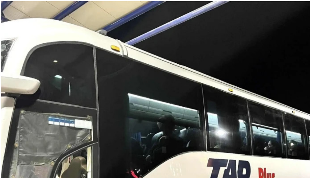
Terminal de autobuses tap los mochis numero