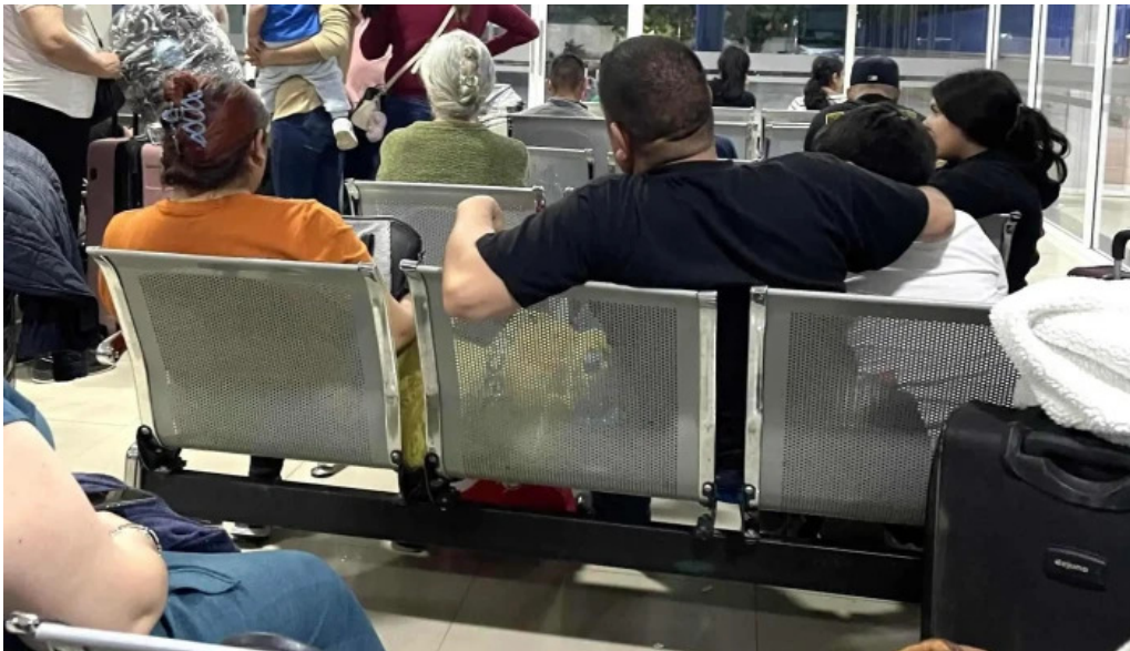
Terminal de autobuses tap los mochis donde