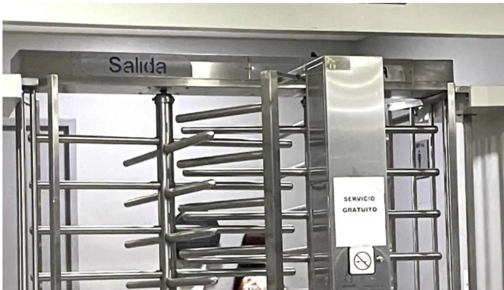
Terminal de autobuses tap los mochis los mochis