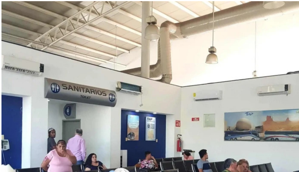
Terminal de autobuses tap los mochis descuentos