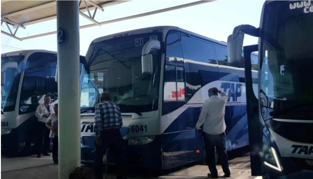
Terminal de autobuses tap los mochis opiniones