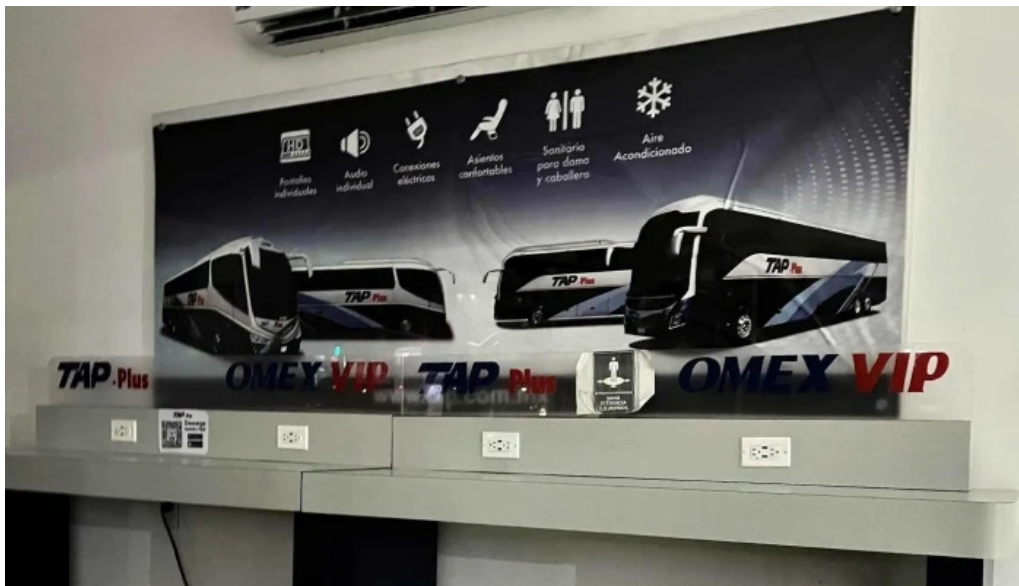
Terminal de autobuses tap los mochis comentarios