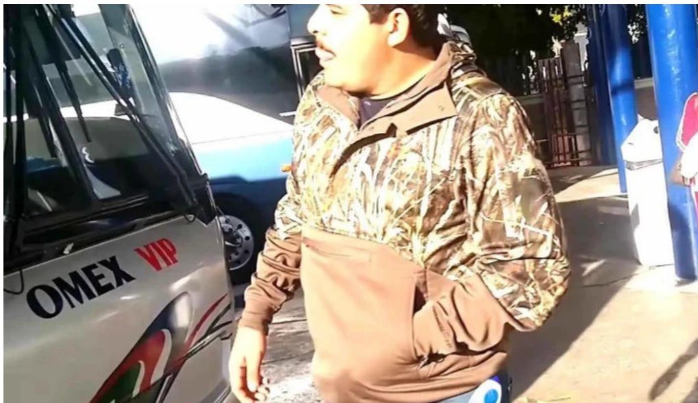
Terminal de autobuses tap los mochos videos