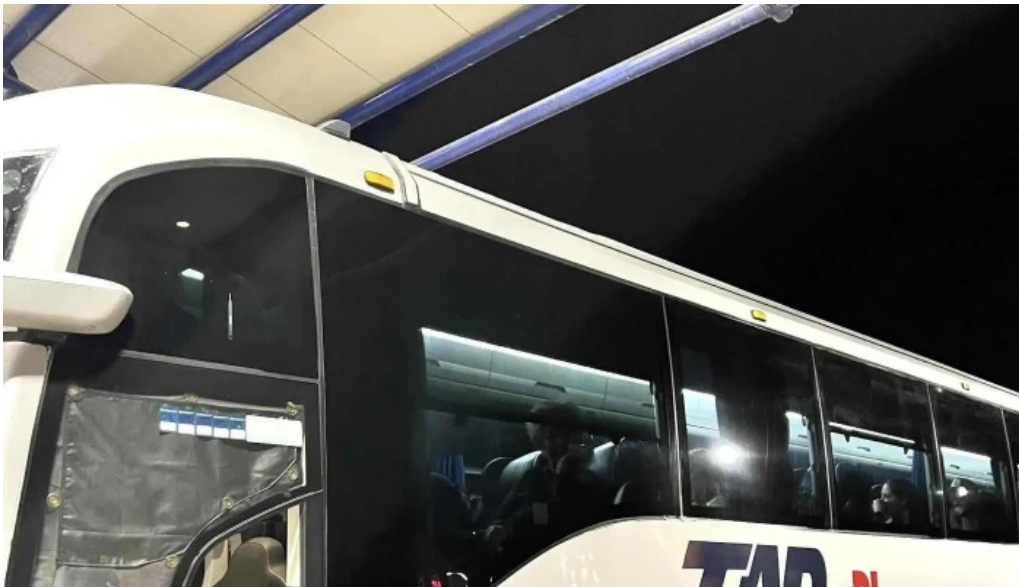
Terminal de autobuses tap los mochos promocion