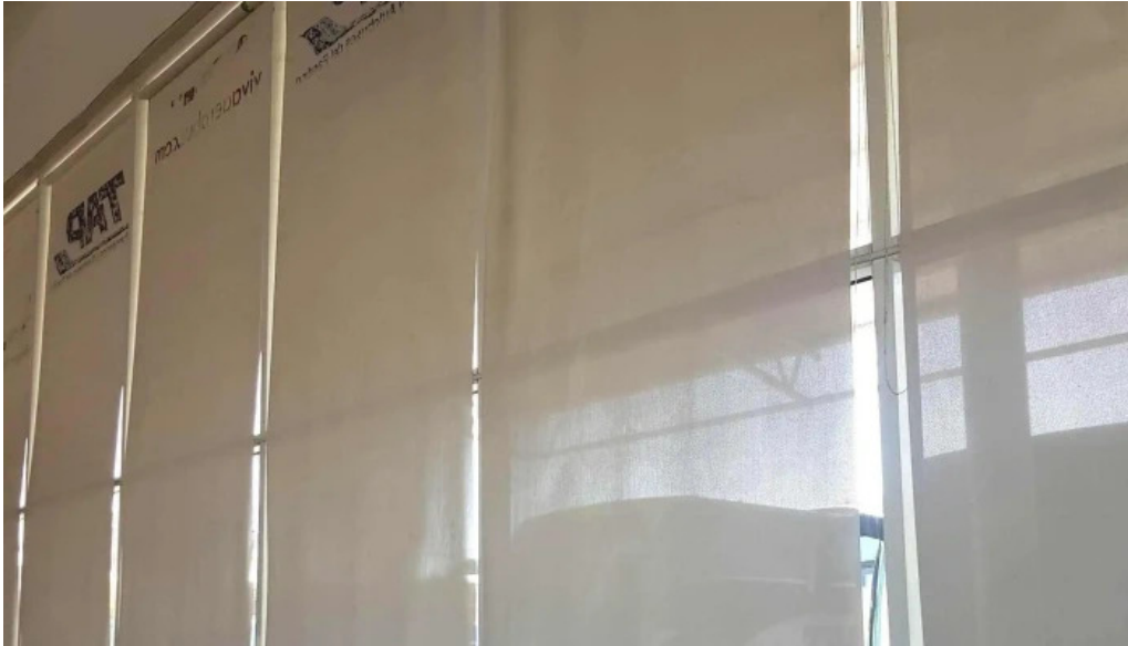
Terminal de autobuses tap los mochos telefono