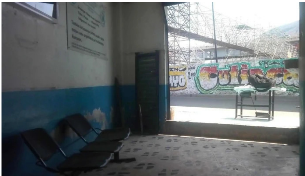
Fypsa valle de chalco solidaridad