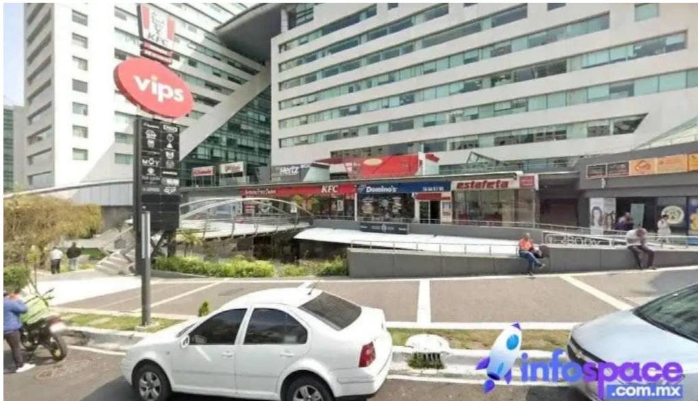
Ciudad de mexico ciudad de mexico