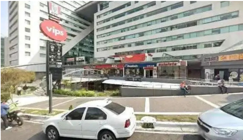
Ciudad de mexico opiniones