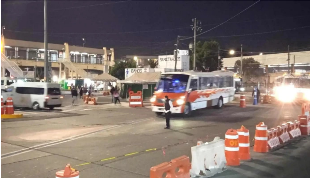
Terminal pantitlan letra k abierto ahora