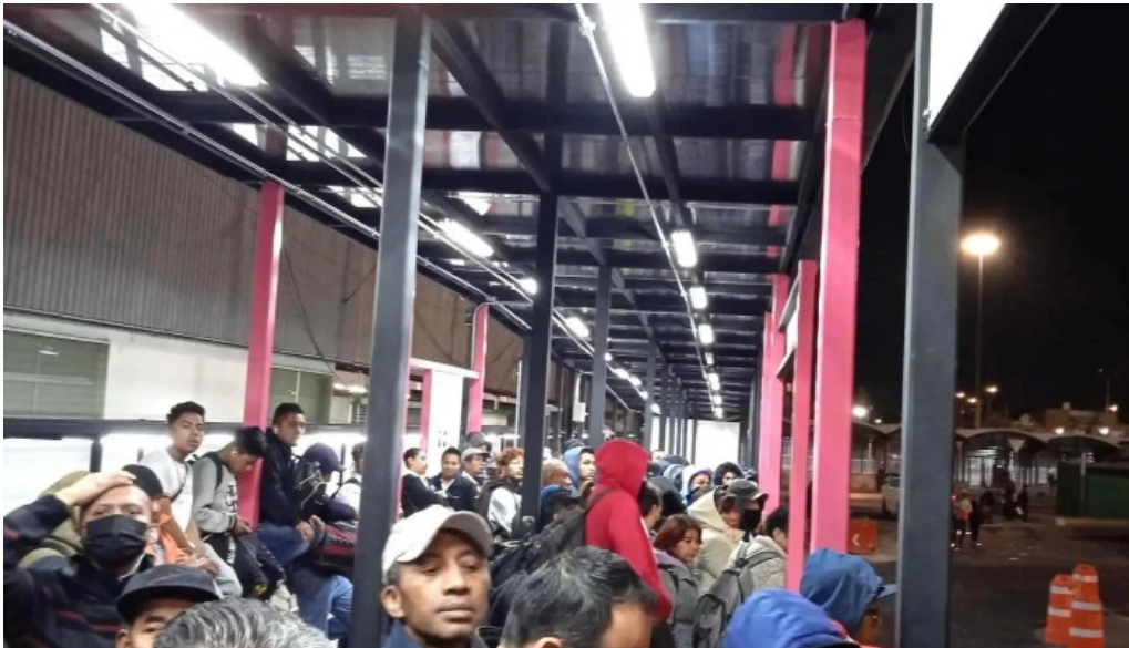
Terminal pantitlan letra k venustiano carranza ciudad de mexico