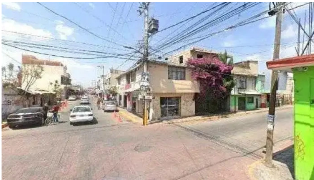
La terminal puntajedeg