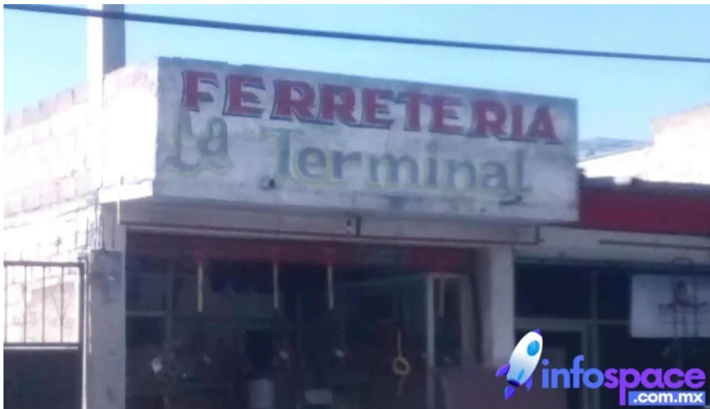
La terminal san mateo atenco