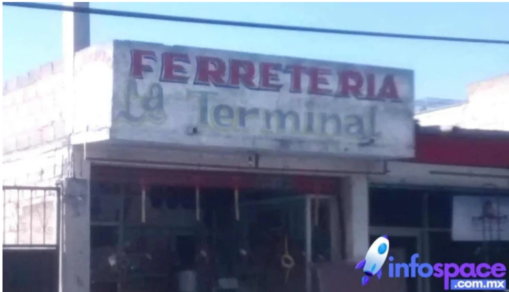
La terminal puntaje