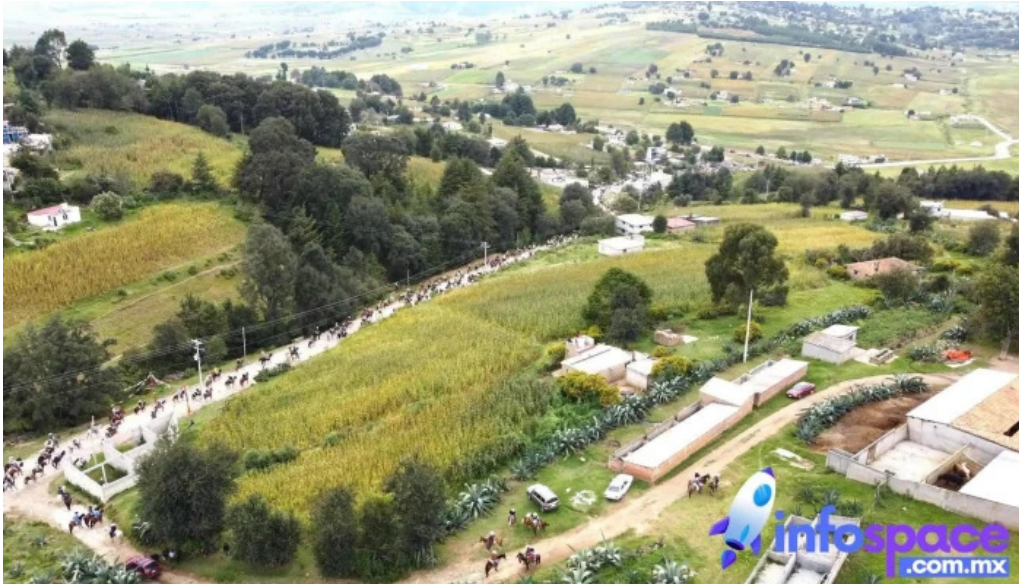
San miguel agua bendita ubicacion