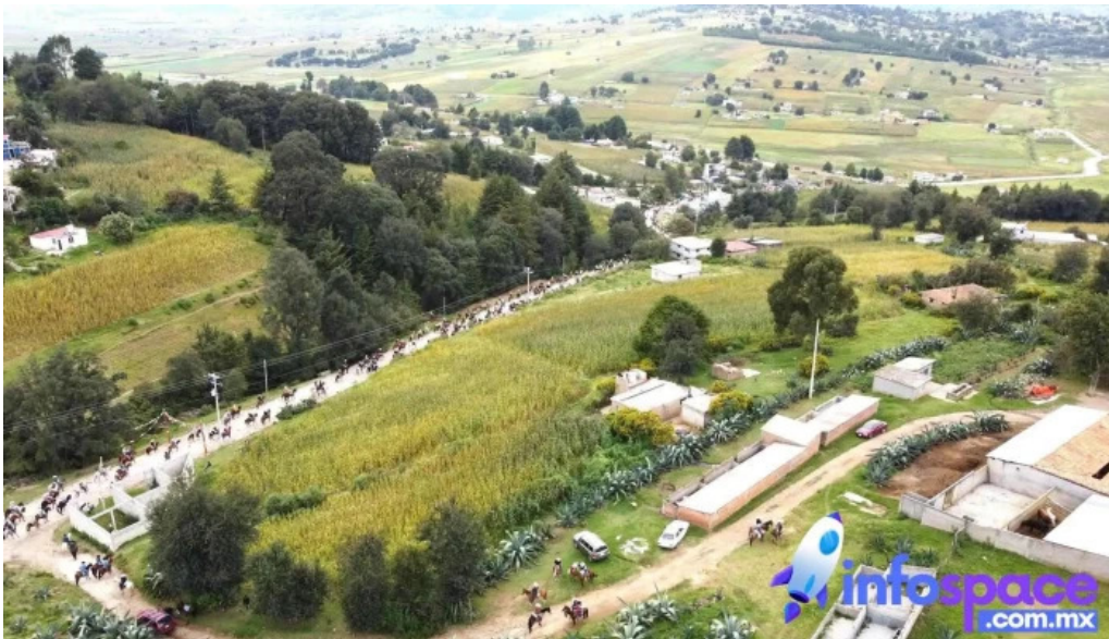
San miguel agua bendita san miguel agua bendita