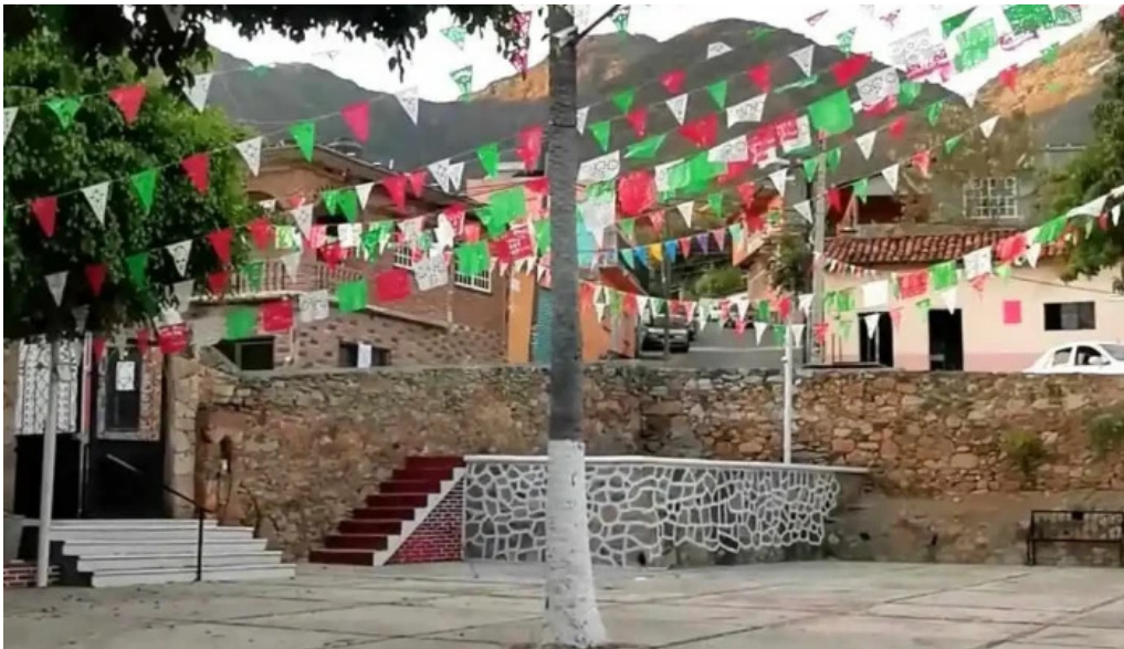
Santa ana zicatecoyan catalogo