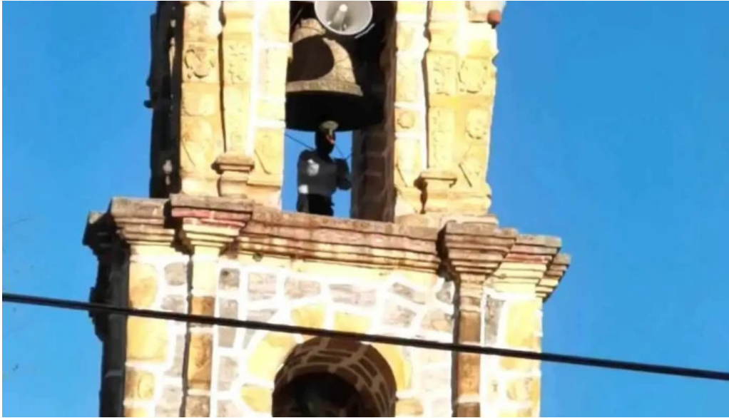
Santa ana zicatecoyan videos