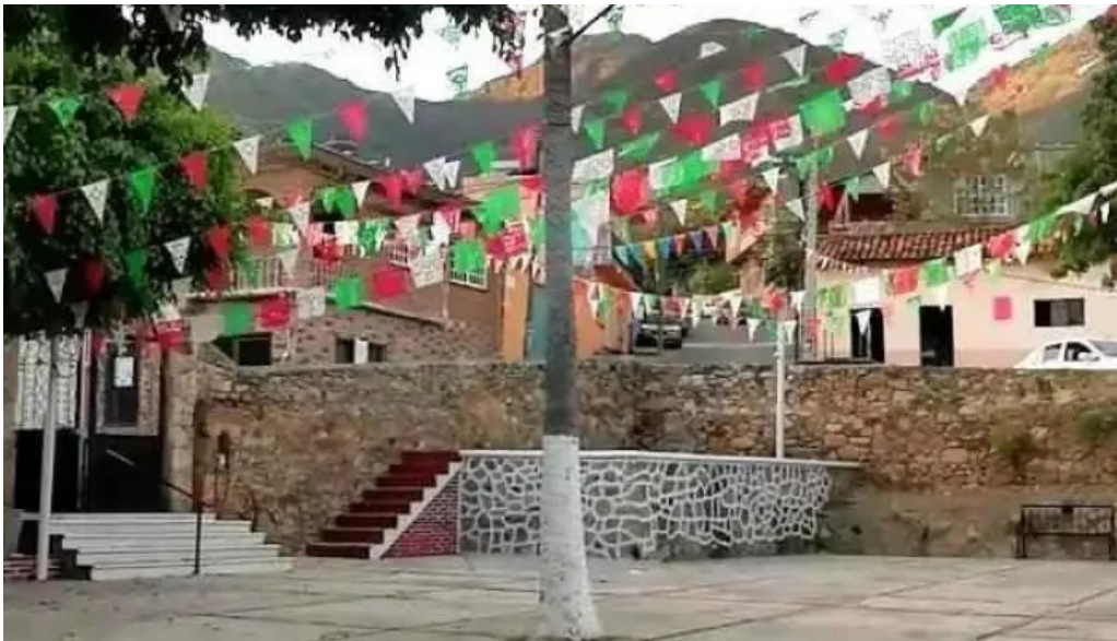
Santa ana zicatecoyan santa ana zicatecoyan